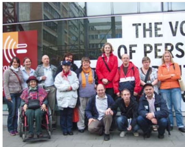
Bildungsurlaub Brüssel 2011, zu Besuch beim Europäischen Behindertenforum

In Kooperation mit Leben mit Behinderung Hamburg